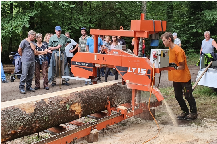
Einsatz der mobilen Säge

Der Waldumgang 2022 führte auf den Mettauerberg und zog auch in diesem Jahr viele interessierte Personen an. Nach der Besammlung auf dem Mettauerberg führte ein rund einstündiger Fussmarsch durch den Mettauer Wald. Anschliessend wurden die Teilnehmenden beim Schützenhaus mit Wurst und Brot vom Grill verpflegt. Während dem Fussmarsch durch den Wald gab es an fünf abwechslungsreichen Posten viel Interessantes zu erfahren, zum Beispiel über die Fusion zum Forstbetrieb Jura-Rhein, über die Betriebspläne Mettauertal und Schwaderloch, über die Borkenkäfer-Suche mit vier Pfoten, über die Astschere und den Strassenunterhalt. Zudem wurde den Besuchern die mobile Säge live vorgeführt.