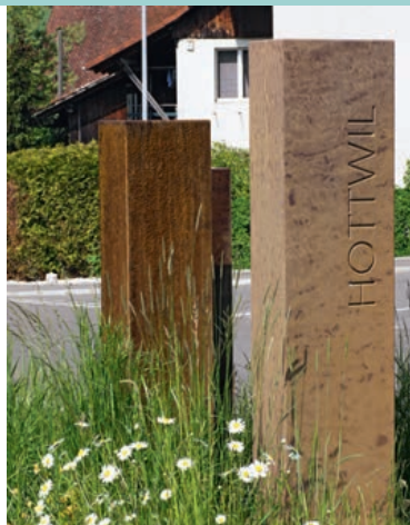
Wasserspiel in Hottwil.