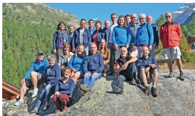
Die reiselustigen Spielleute auf der Fafleralp.

bezug mit einem köstlichen Nachtessen verwöhnt wurden. Es wurde ein schöner Abend mit angeregten Gesprächen und Schwelgen in alten Theatererinnerungen und auch den Abstieg zur Dependence des Berghotels schafften zum Glück Jung und Alt. Nach einem reichhaltigen Frühstück am Sonntagmorgen ging die Reise weiter nach Thun, wo sich die