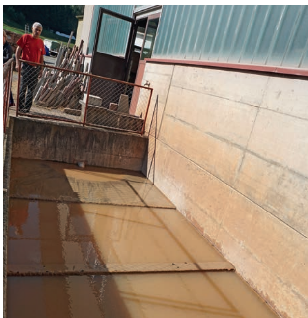
Kläranlage im Werksareal.

die Felder ausgebracht. Mit diesem eigenen Wasserkreislauf kann der Wasserverbrauch sehr tief gehalten werden. Man benötigt nur rund 30 m 3 pro Jahr.