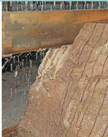
Gattersäge mit diamantbestücktem Sägeblatt.